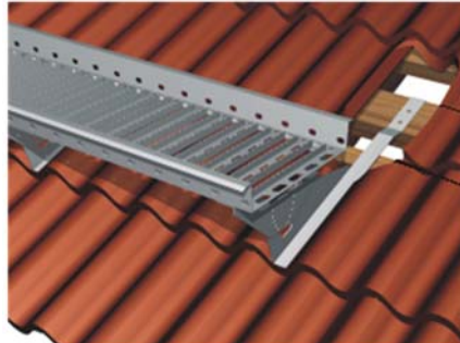
Kuva 2. Tiilikatto TK-KAT